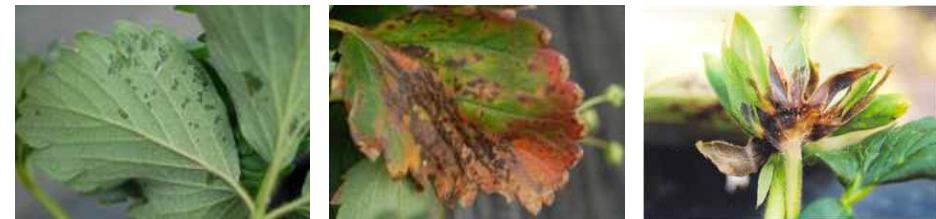
【초기 잎 뒷면 증상】

⇒ 최근 일부 지역에서 발생하고 있으며, 모주를 통해 전염되므로 병에 걸린 포기는 제거하여 지정된 장소에서 태우거나 땅에 묻고, 병이 발생한 딸기는 적용약제를 살포하여 피해를 줄여야 함