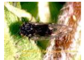
【꼬마배나무이 월동형 성충】

○ 배에 발생하는 꼬마배나무이는 거친 껍질 밑에서 성충상태로 월동을 하고, 2월 중순부터 나무 위쪽의 열매가 달리는 가지로 이동하며 3월 상순부터 산란을 시작하고 개화 전 무렵부터 알이 부화됨