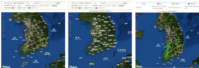
【2015년 2월 24일】 【2016년 2월 24일】 【2017년 3월 2일】 《꼬마배나무이 최적 방제적기(녹색) 예측 지도》