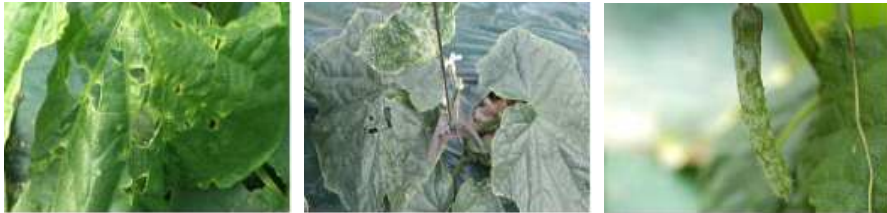
【잎이 찢어진 피해】 【순뭇이, 새순 탈색 피해】 【오이 과피의 피해】

⇒ 식물체의 잎이 찢어지거나, 순뭇이, 새순 탈색, 과피에 코르크 현상 등 피해증상이 나타나면 즉시 응애 방제 약제를 식물체 전체에 골고루 살포하여 방제하고 벧짚은 적당한 양 사용