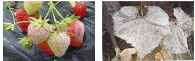
【딸기 흰가루병】 【오이 흰가루병】

⇒ 흰가루병 포자는 일출 후부터 오전 10시경 까지 포자 비산이 가장 많이 이루어지므로 약제 살포는 10시 이전에 하는 것이 효과적이고, 같은 계통의 약제 연용 시 약제저항성균이 쉽게 생겨 방제효과가 떨어지게 되므로 반드시 다른 계통의 약제를 번갈아 가며 살포