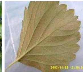
【잎 뒷면 점박이응애 피해】