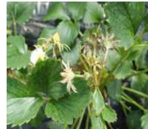
【꽃대 점박이응애 피해】