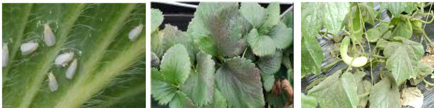
【온실가루이 성충과 알】 【온실가루이 그을음 피해】 【목화진딧물 그을음 피해】

⇒ 이들 해충들은 온도가 올라가면서 확산될 우려가 있으므로 끈끈이 트랩을 활용하여 주의 깊게 예찰하고, 발견 초기에 적용약제로 방제