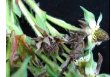
【딸기 꽃곰팡이병 증상】