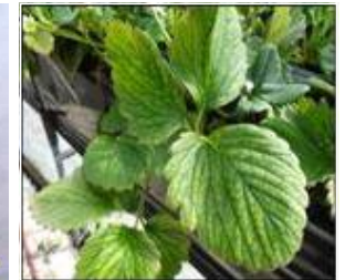
【잎 앞면 점박이응애 피해】