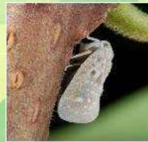
❖ 【미국선녀벌레 성충 및 알】 농작물 병해충 발생정보