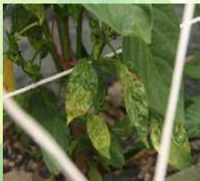
【고추 TSWV 증상】

⇒ 진딧물 방제를 철저히 하고 작물이 시설 내에 연중 재배되어 항상 전염원은 있으므로 즙액에 의한 접촉전염을 막기 위해 병든 식물체는 즉시 제거