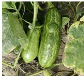
【호박 ZYMV 증상】