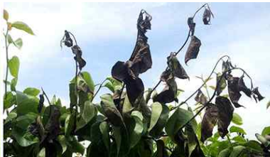
【배나무 가지의 병징】

⇒ 이상증상이 보이면 가까운 농업기술센터나 농업기술원에 즉시 신고하여 과수화상병 확산을 예방하여 주시기 바랍니다