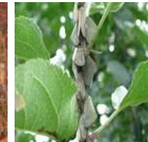
【갈색날개매미충 및 감나무 산란】