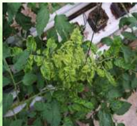
【토마토 TYLCV 증상】