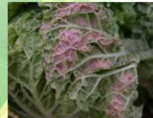
【배추 노균병 증상】