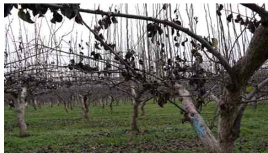
【겨울철 가지의 병징】