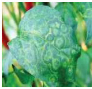
【다중 원형반점 증상】