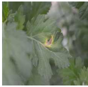
【잎의 괴사반점 증상】