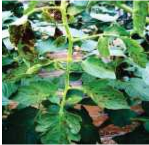
【잎 괴저반점 증상】