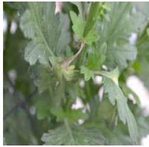
【잎자루의 괴사 증상】