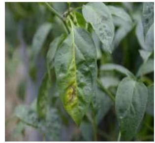
【국화 하우스 주변 고추 잎 괴사반점】