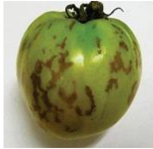
【괴저 원형반점 증상】