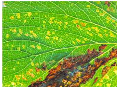
【후기 잎 증상】