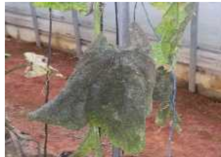
【진딧물에 의한 그을음병】