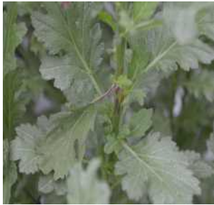
【줄기의 괴사 증상】